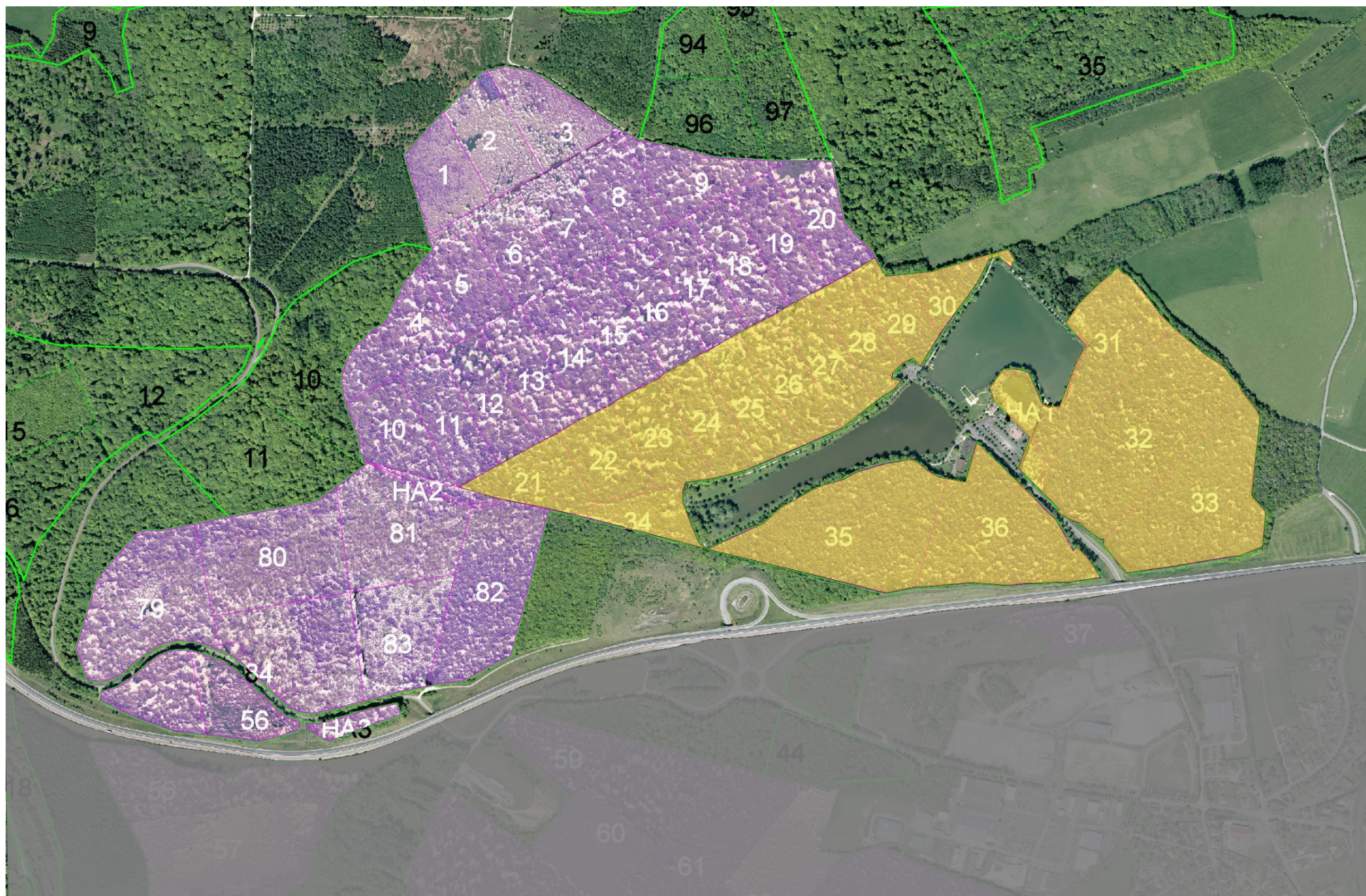
Lot 2 : les parcelles jaunes constituent la zone de sécurité