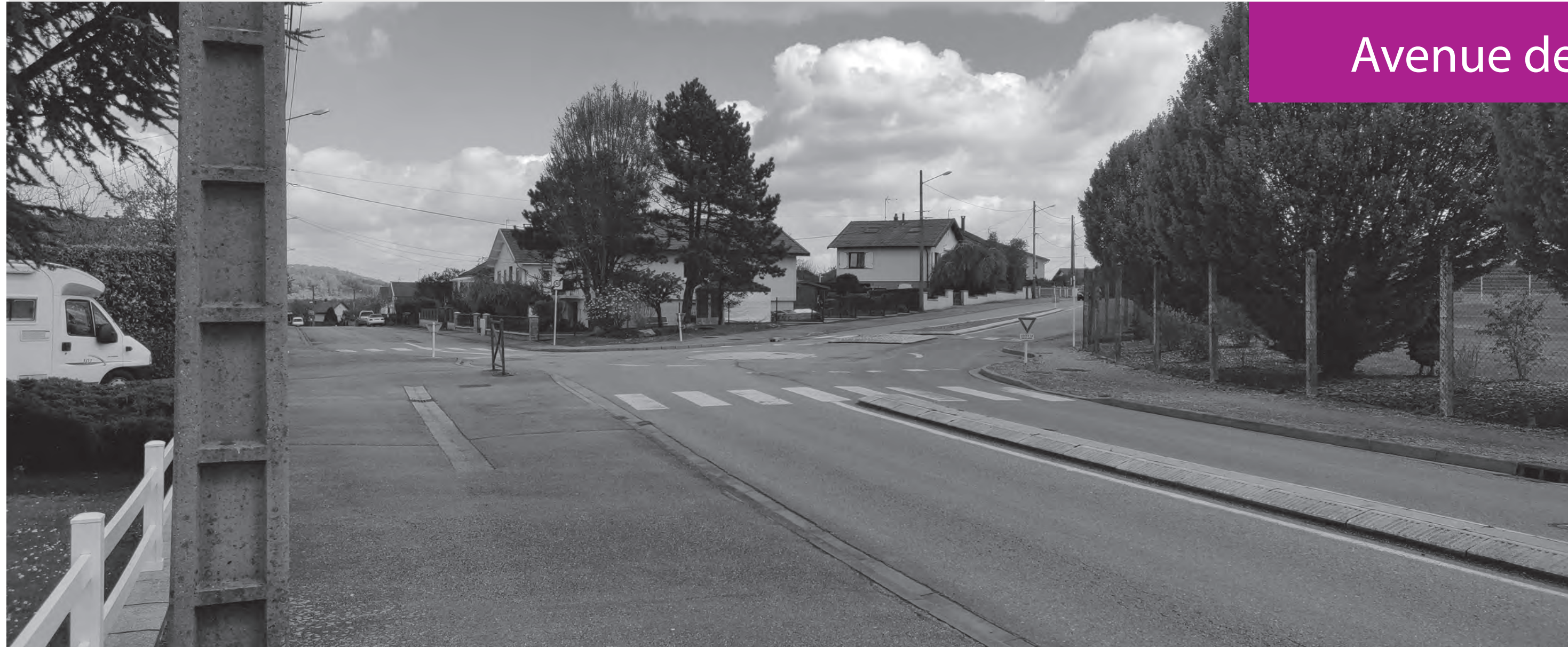
Avenue des Pierrottes