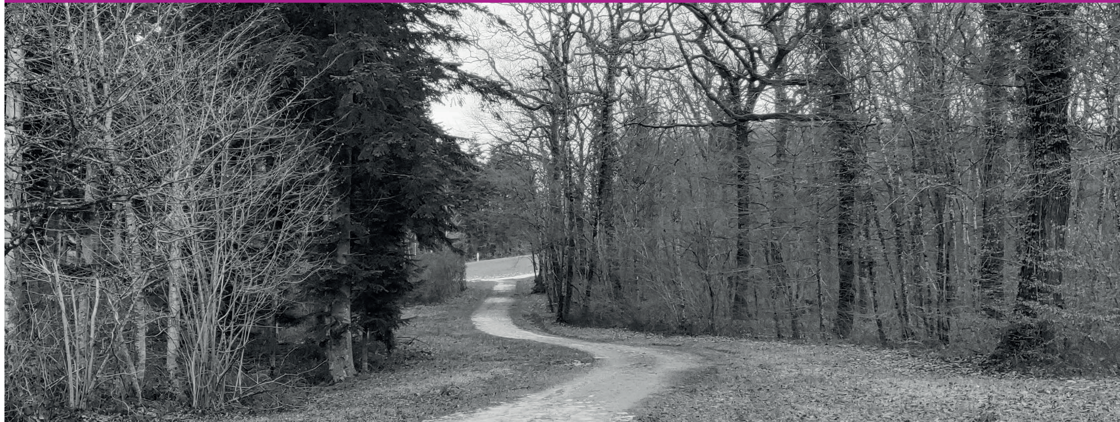
Scénario 1 : voie douce en milieu forestier