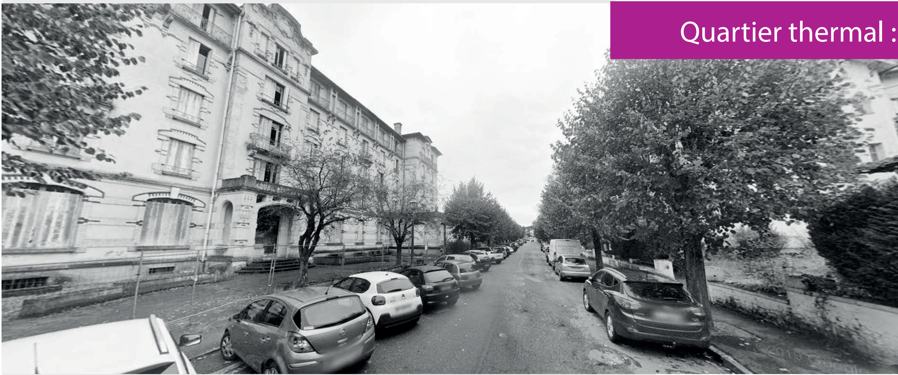
Quartier thermal : avenue des Tilleuls