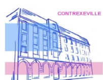
Lycée des Métiers Pierre Mendès-France Le Goût et le Bien-être